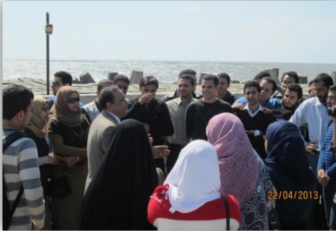
رحلة ميناء وميناء