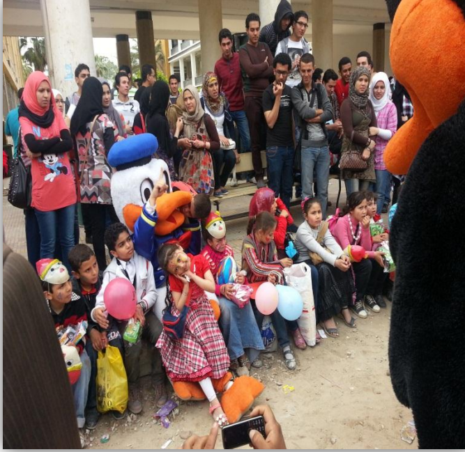
صورة من فاعليات يوم البنتيوم