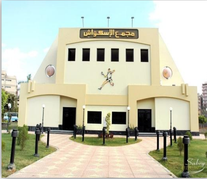
القوية الأليمبية - مجمع الإسكواش

القوية الأليمبية: وتوجد داخل الحرم الجامعي لجامعة المنصورة. يوجد بالقوية الأليمبية ملاعب لممارسة الأنشطة الرياضية الأتية: كرة قدم - سباحة - اسكواش - تنس ارضي - كرة سلة - الكرة الطائرة - كرة اليد - الكاراتية - التايكوندو. وتفتح القوية أبوابها أمام طلاب الجامعة.