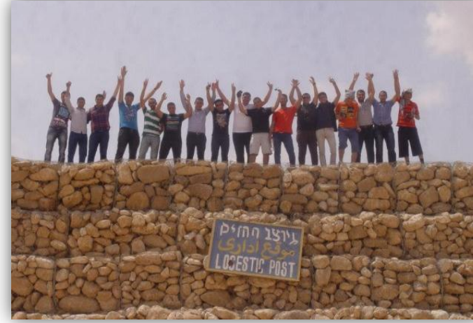
رحلة جنوب سيناء