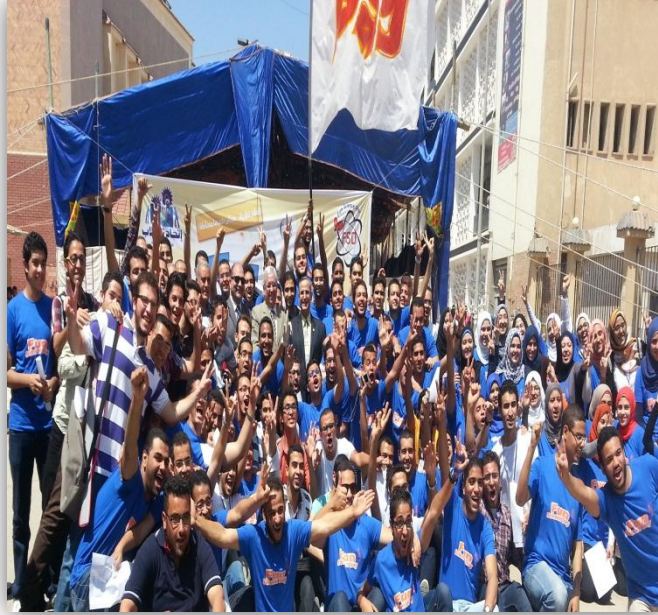
Fun Science Day2