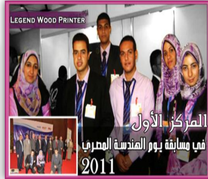
فريق LEGEND WOOD Printer