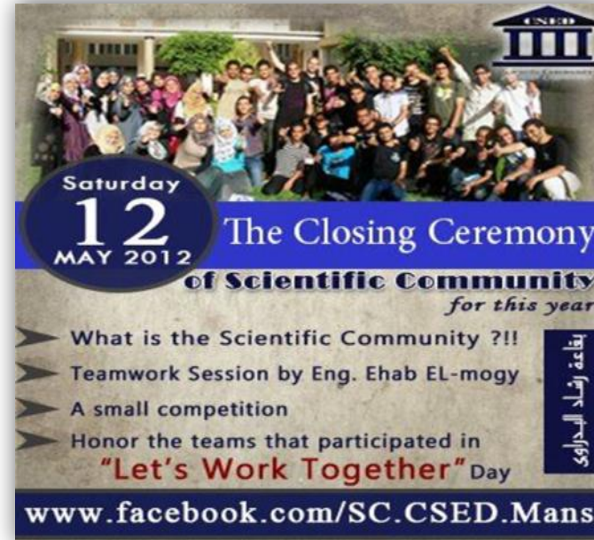
Let's Work Together