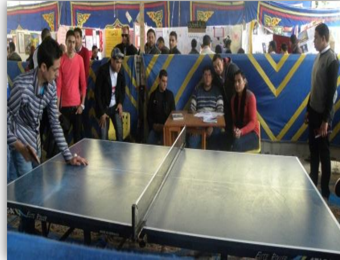
وورة تنس الطاولة