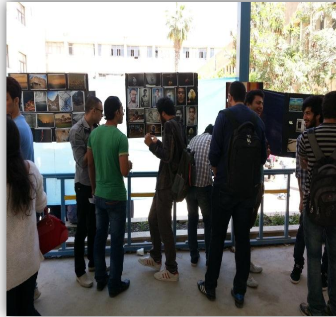
جانبا من (معرض الفنية)