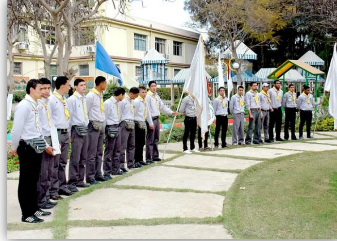
(أحرى فاعليكم فريق الجواله بالجامعة)