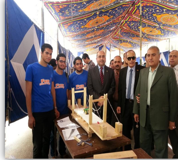
جانب من معرفى Fun Science