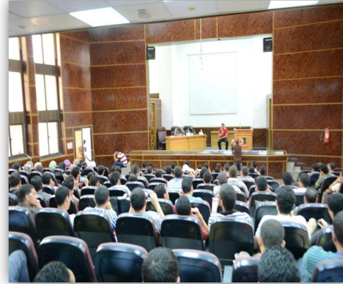
مسابقة وريل (القرآن الكريم)