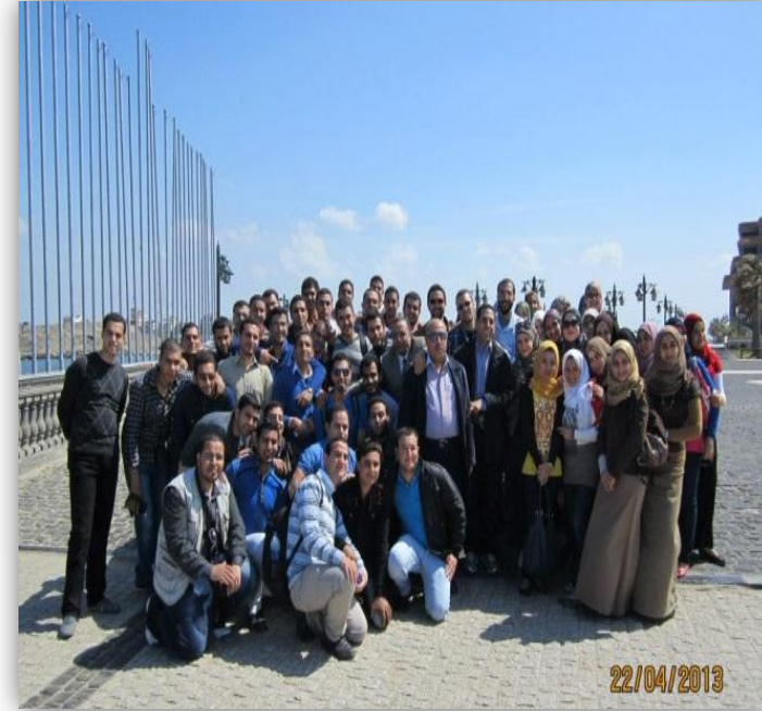
كلية الهندسة - جامعة المنصورة