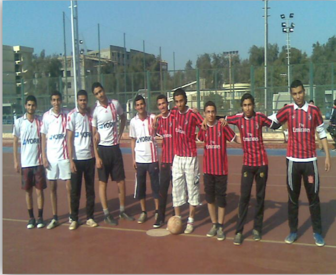
الاستراة في وورة (الفرم) الخامسة