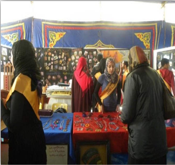
جانبا من (معرض الإنتاجية)