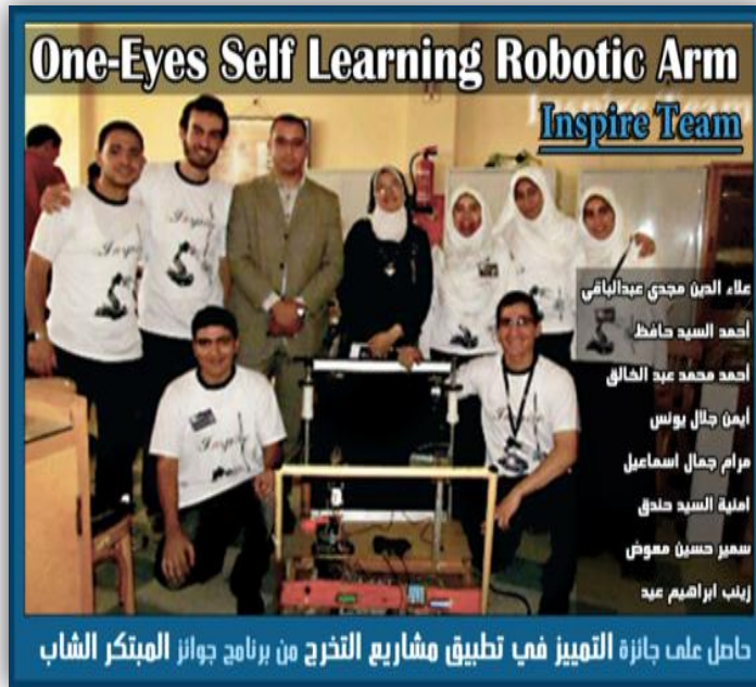
One-Eyes Self Learning Robotic Arm