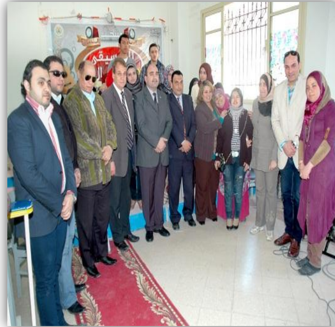
الأستاذة في سابقك الفناء، والشعر