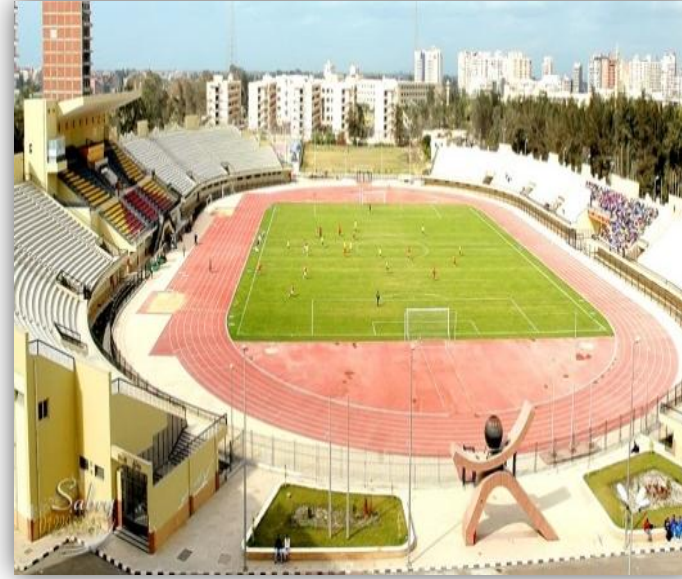
استاد جامعة المنصورة لكرة القدم